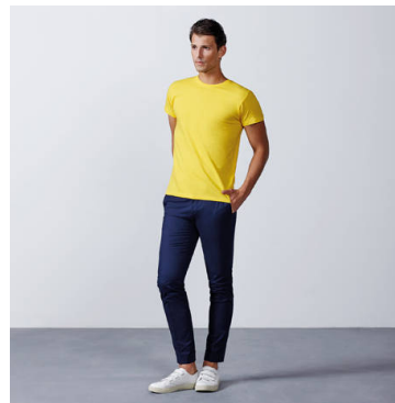
ATOMIC 150 CA6424