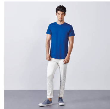
DOGO PREMIUM CA6502