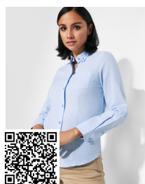
OXFORD WOMAN CM5068